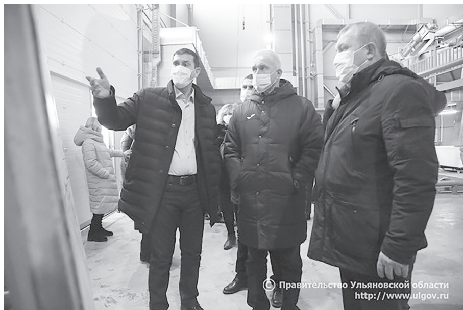
Правительство Ульяновской области http://www.ulgov.ru

Результатом реконструкции станет не только снижение в три раза объема загрязненных стоков, сбрасываемых в Волгу, но и увеличение пропускной